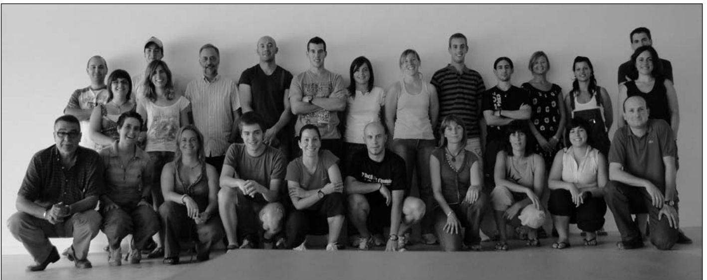
LaPiscina compta amb un equip de 20 professionals a punt per donar servei a tots els usuaris

PISCINA COBERTA MUNICIPAL DE TORELLÓ Camí nou de Can Parrella, 5 Tel. 93 850 54 65 www.lapiscinadetorello.cat