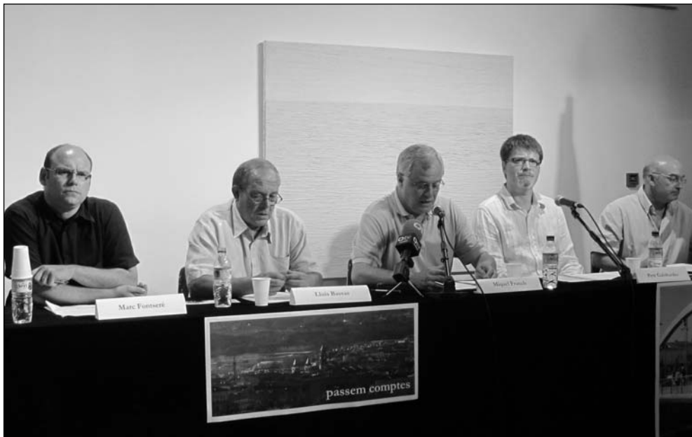
Els responsables de les cinc grans àrees de treball de l'Ajuntament de Torelló

L'elaboració del Pla Local d'Habitatge, la millora de la Xarxa d'Abastament d'Aigua i el condicionament dels espais de la via pública, entre altres, són algunes de